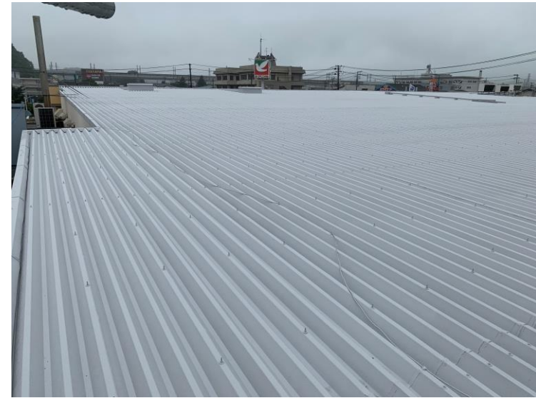
塗装後の折板屋根写真